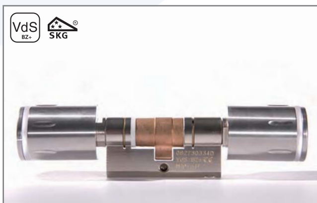
DOM Protector® 2 zijden gecontroleerd