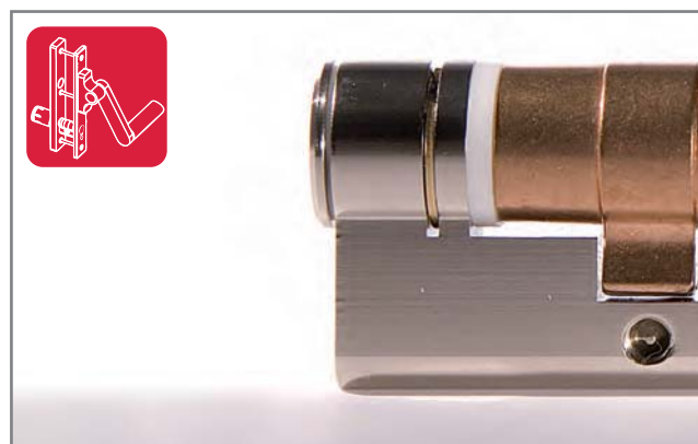
DOM Protector® EE zonder knop binnenzijde