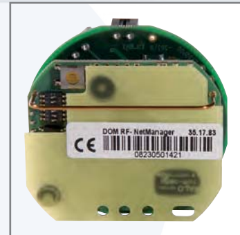
DOM RF NetManager